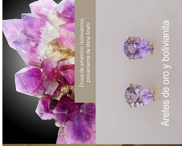
Drusa de ametrino (bolivianita), proveniente de Mina Arañá