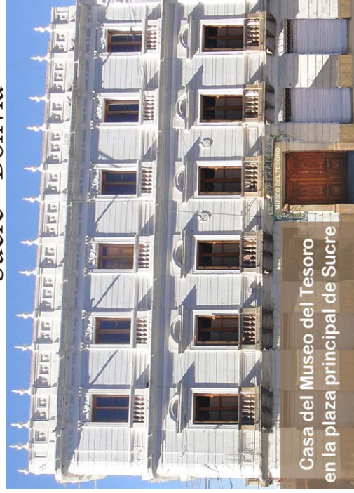
Casa del Museo del Tesoro en la plaza principal de Sucre