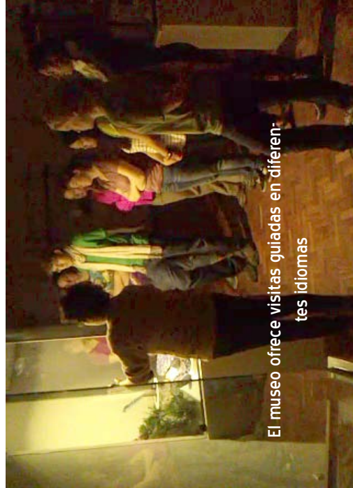
El museo ofrece visitas guiadas en diferentes idiomas