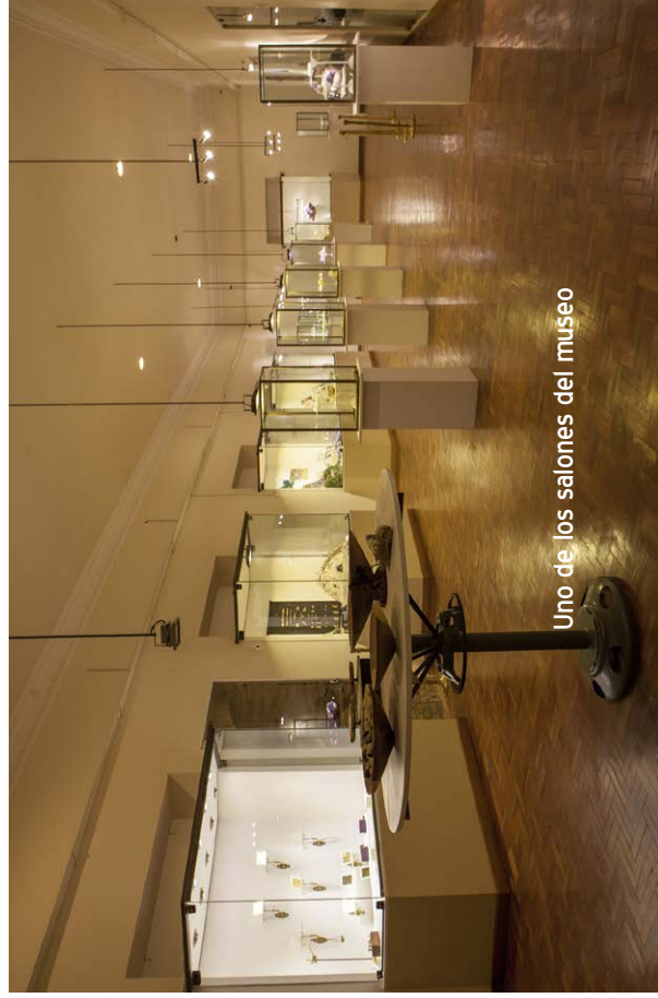
Uno de los salones del museo