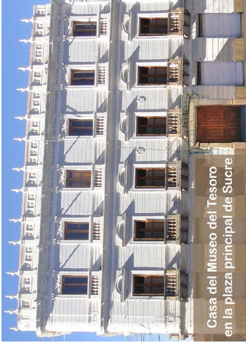
Casa del Museo del Tesoro en la plaza principal de Sucre