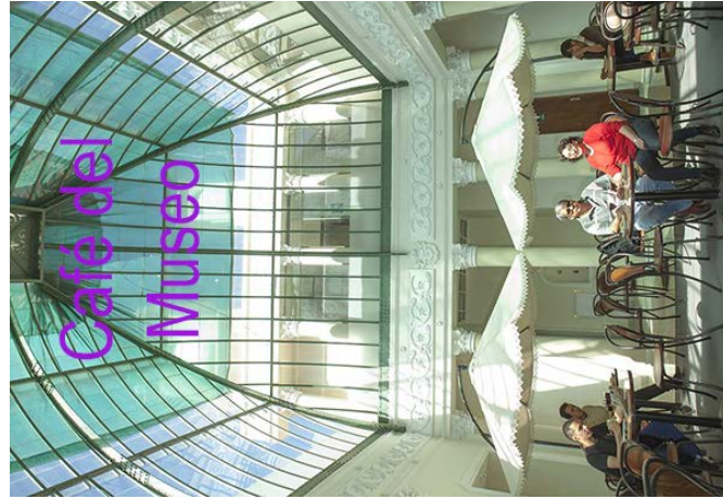
Café del Museo