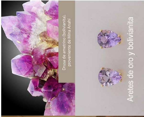
Drusa de ametrino (bolivianita), proveniente de Mina Arañi