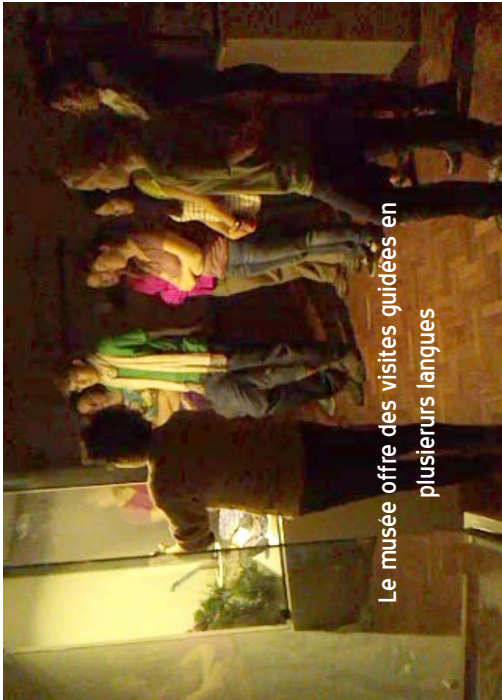
Le musée offre des visites guidées en plusieurs langues